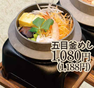
五目釜めし 1,080円 (1,188円)