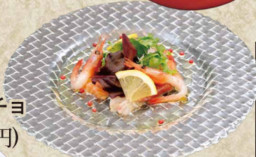
マグロのユッケ風 カルパッチョ 980円(1,078円)