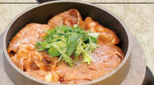
宮崎牛釜めし 1,380円 (1,518円)