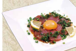
炙りどろサーモン さっぱりポン酢 980円(1,078円)