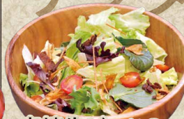
宮崎牛ピッツの 和風カリカリサラダ 1,180円(1,298円)