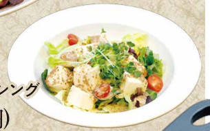
お豆腐サラダ 食べる胡麻ドレッシング 780円(858円)