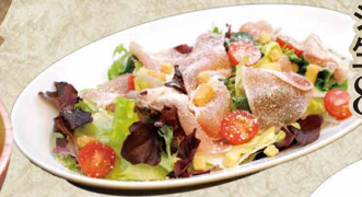
シーザー風 生ハムのサラダ 880円(968円)