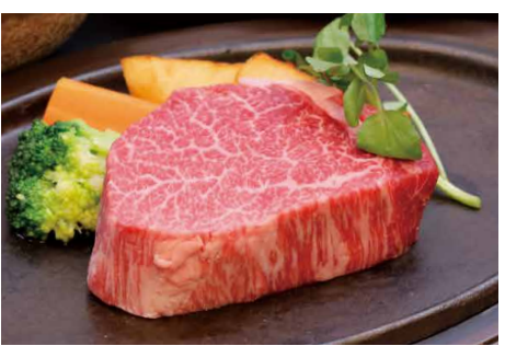
みやざき和牛ヘレスステーキ

※季節や食材の入荷状況によって、器や内容が変更になる場合がございます ※( )内は税込価格です ※写真はすべてイメージです