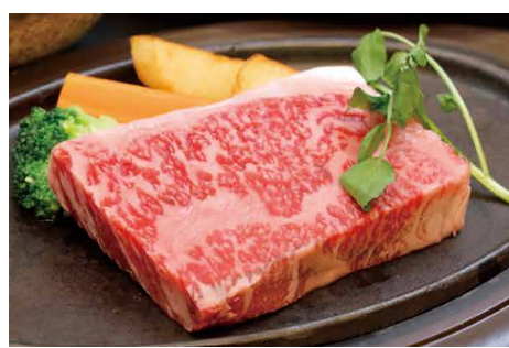
みやざき和牛ロースステーキ