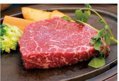
宮崎牛赤身ステーキ