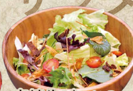
宮崎牛ピッツの 和風カリカリサラダ 1,180円(1,298円)