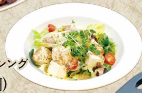
お豆腐サラダ 食べる胡麻ドレッシング 780円(858円)