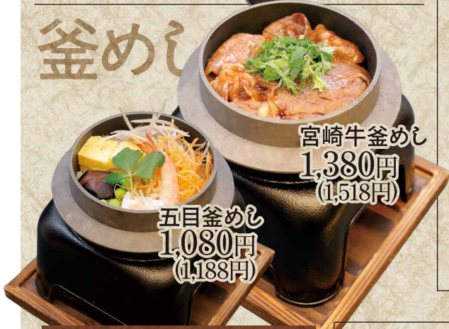
五目釜めし 1,080円 (1,188円)