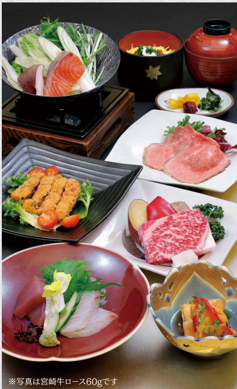
※写真は宮崎牛ロース60gです

※季節や食材の入荷状況によって、器や内容が変更になる場合がございます ※( )内は税込価格です