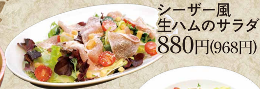
シーザー風 生ハムのサラダ 880円(968円)